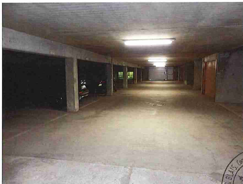
Photo 12 - Vue générale du parking de la résidence

La place de stationnement porte le n° 449 et est située au sous-sol du bâtiment E de la résidence.