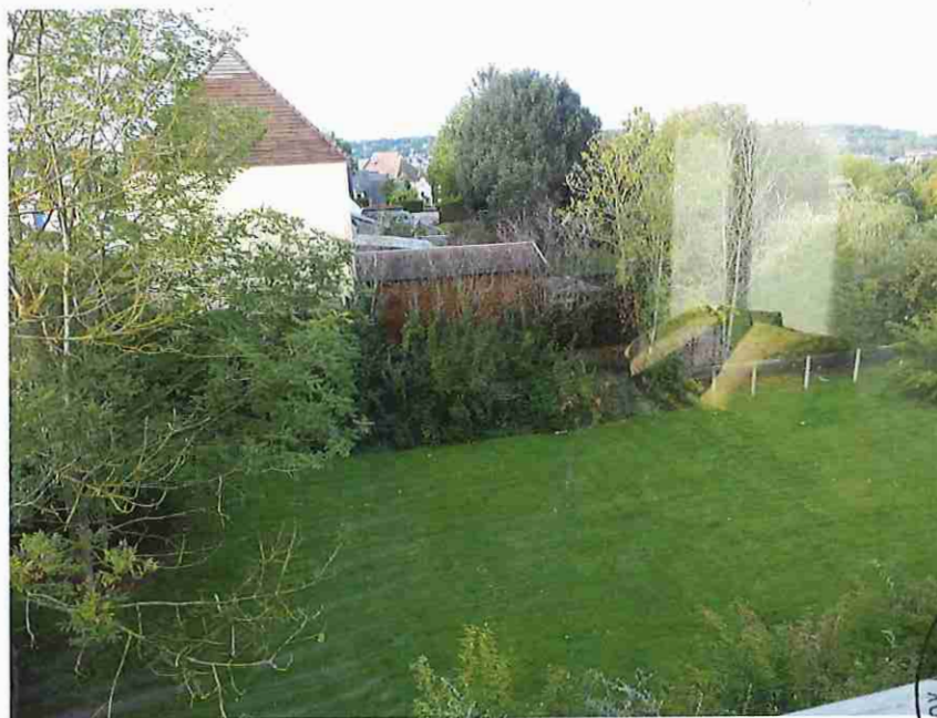
Photo 8 - Vue depuis l'une des fenêtres du séjour